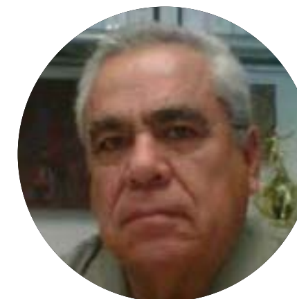
ESCRITORES MEXICANOS DESDE LA CONFRATERNIDAD JOSÉ HUMBERTO CHOZA GAXIOLA

Tengo la firme intención de reunir una serie de escritos de destacados escritores mexicanos de lengua española. Con la maravillosa idea de que estos creadores de nuestras letras, que están dispersados, dejen de estarlo. Es muy posible que los resultados sean insólitos y de valía especial. También puede ser lo contrario, más, sin embargo, creo que vale la pena el esfuerzo, con ello que los lectores de estos artículos tengan la posibilidad de disfrutar el placer de divertirse, ya que, si logro obtener cercanía entre los eruditos y los lectores queridos, mi afán estará cumplido.