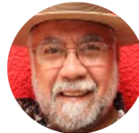
CORTOS REFLEXIVOS OSWALDO DEL CASTILLO CARRANZA LA CUARTA TRANSFORMACIÓN HABLEMOS DE LA DISCRECIONALIDAD

Las teorías administrativas, el total de ellas, se enfocan en el orden y la disciplina.