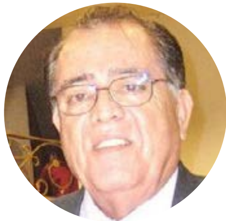
DE LA FALACIA, ¡ALEJARNOS! COLUMNA VERTEBRAL ERNESTO ALCARAZ VIEDAS

No podemos simplificar situaciones tan complejas poniendo como remedio dos opciones igual de excluyentes, tal si fueran las únicas posibles. Ningún embuste nos debe llevar a una opción única, frente a una situación determinada. No podemos aceptar todo postulado como si fuera un dogma de fe. Es como decir: “Estás conmigo o estás contra mí”. Eso sólo lo entenderíamos en una dictadura o bajo un régimen autoritario.