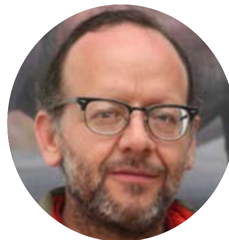
ESTORBO DE MI CORAZÓN ALEJANDRO PÁEZ VARELA

Somos, todos, una dualidad: debilidades y fortalezas. En un mismo empaque cargamos sangre de ganadores y perdedores. Por lo mismo, somos, todos, estorbo de nosotros mismos. Nuestras debilidades y nuestros impulsos suelen atravesarse a nuestros objetivos y a nuestros deseos. Eso le pasa también al Presidente de México. Pero a diferencia de nosotros, él no puede equivocarse porque sus errores afectan la vida de decenas de millones. Se ve tan simple desde aquí, desde donde escribo; claro que allá arriba debe verse de otra manera.