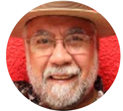
CORTOS REFLEXIVOS OSWALDO DEL CASTILLO CARRANZA LA CUARTA TRANSFORMACIÓN CASTILLOS DE ARENA

Porque la frialdad y la displicencia en la conducta del presidente cunde en el ánimo y acción de sus colaboradores. Su prioridad es hacer proselitismo común, en aras de alcanzar posiciones electorales personales, o de grupo, para el 2021. De dos años haciendo campaña y poco tiempo para gobernar, es igual a resultados cuestionables.