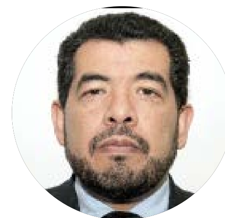
¿DEBE TWITTER COMPORTARSE COMO FACEBOOK? M. FERNANDO DÁVILA

El anuncio de la herramienta mediante la cual se harán públicos detalles de la publicidad (propaganda) política que se le pague a Facebook, ha causado reacciones diversas tanto en los usuarios como en los consumidores.