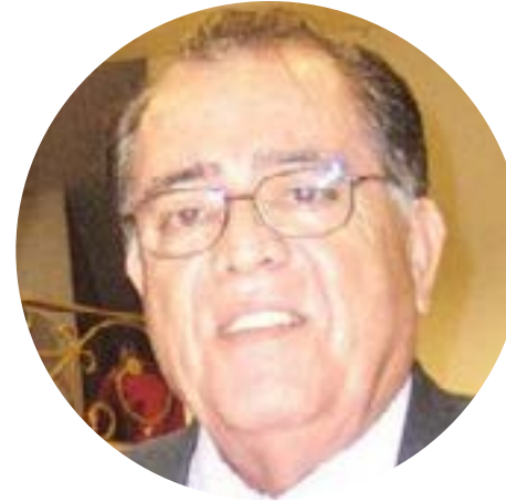
¿SE POLITIZA LA JUSTICIA? COLUMNNA VERTEBRAL ERNESTO ALCARAZ VIEDAS

Es inadmisibles considerar la poca seriedad del presidente López Obrador cuando de asuntos de gobierno se trata, hábilmente los disfraza en propaganda para mejorar su aceptación social y el respaldo para MoReNa. Fustiga a la ciudadanía sin advertir que alterando las emociones de sus seguidores de “mecha corta”, facilita que la pradera nacional se incendie. Y todo para que la disidencia civil sea aplanada y advertida a que se defina: ¡Se alinean o no a la Cuarta Transformación!