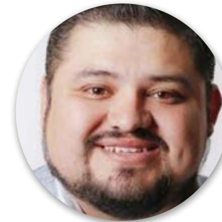
EL RESENTIMIENTO SOCIAL NO SE ALIVIA CARÁCTER POLÍTICO LEONEL SOLÍS

1.-La denuncia de Emilio Ricardo Lozoya Austin contra tres expresidentes de la República y otros actores de la política nacional puede que no sea suficiente para un fuerte castigo; pero ya lucen la medalla de oro en corrupción, representan la actual división del País y son la bandera para que el presidente Andrés Manuel López Obrador obtenga la mayoría de los legisladores y gobernadores a elegir el próximo año.