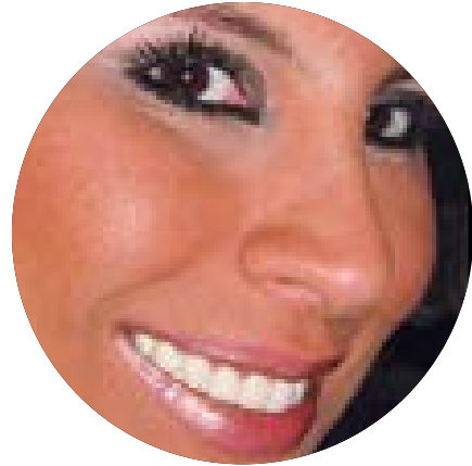
MARCA CULTURAL JULIA PINEDA

Desde hace 44 años, el cinco de junio celebramos el Día Mundial del Medio Ambiente, la fecha más importante en el calendario oficial de las Naciones Unidas para fomentar la conciencia y la acción global a favor de la protección del medio ambiente. Cada Día Mundial del Medio Ambiente se elige un país anfitrión diferente en el que tienen lugar las celebraciones oficiales. El enfoque en el país anfitrión ayuda a resaltar los desafíos ambientales que allí se enfrentan y es una forma de apoyar sus esfuerzos, por lo que este año el anfitrión fue India. Hoy en día, los gobiernos y organizaciones emprenden actividades que reafirmen su preocupación por la protección y el mejoramiento del medio ambiente, con miras a la conciencia de los problemas de éste. El Día Mundial del Medio Ambiente ha ayudado a concientizar y crear presión política para abordar preocupaciones crecientes como la reducción de la capa de ozono, la gestión de productos químicos tóxicos, la desertificación o el calentamiento global. Cada Día Mundial del Medio Ambiente se centra en una preocupación ambiental particularmente apremiante. El