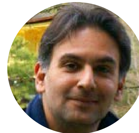
CUARENTA AÑOS DE APERTURA LA NUEVA NAO ALFONSO ARAUJO

China celebra este año el 40 aniversario de la inauguración de su Política de Apertura Económica. Por esa política, China finalmente rompió el ensimismamiento en que había estado durante un periodo de casi tres décadas dominado por factores ideológicos y con graves repercusiones económicas.